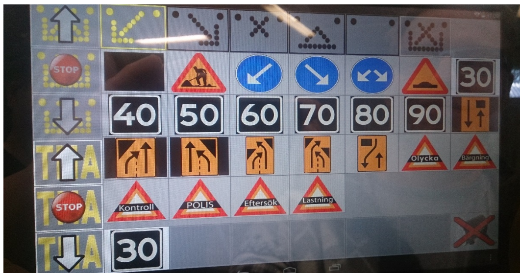
Symbolerna 30 och vänsterpil har valts

När budskapet valts visas det på skylten och bekräftas på pekpanelen med att symbolen lyser. För att släcka skylten används den svarta symbolen längst upp till vänster.